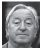
Jiří Lábus, herec