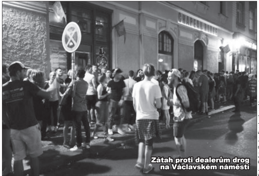
Záťah proti dealerům drog na Václavském náměstí

Protikuřácký zákon zvýšil hluk v ulicích cca o 50 decibelů.