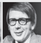
Miloslav Šimek HUMORISTA