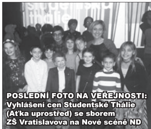
POSLEDNÍ FOTO NA VEŘEJNOSTI: Vyhlášení cen Studentské Thálie (Aťka uprostřed) se sborem ZŠ Vratislavova na Nové scéně ND