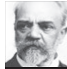
Antonín Dvořák MANŽEL