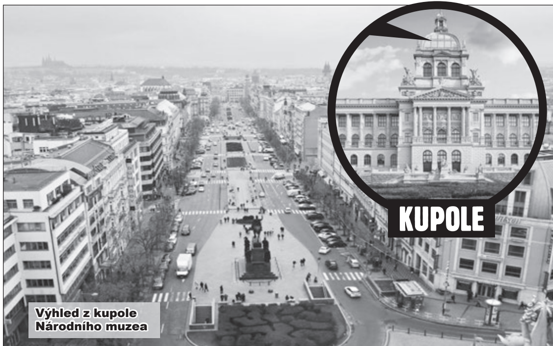
Výhled z kupole Národního muzea