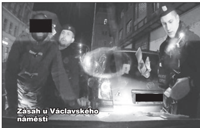
Zásah u Václavského náměstí